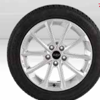
72 AZW Diamant