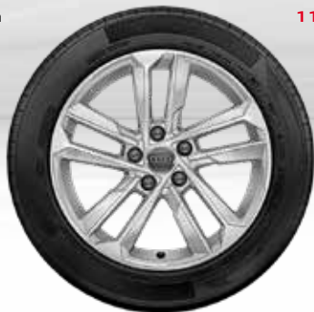
10 5-paralelných lúčov