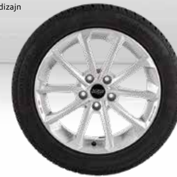
72 AZW Diamant