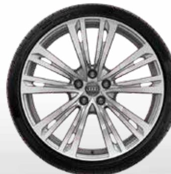
39 10-paralelných lúčov