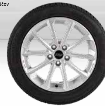
72 AZW Diamant