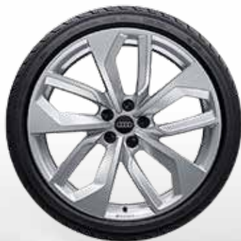
16 5-dvojítych lúčov