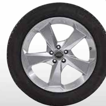
75 AZW Aspen