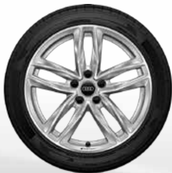
14 5-dvojítych hranatých lúčov