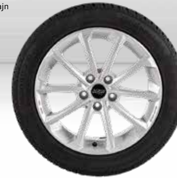
72 AZW Diamant