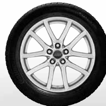
71 AZW Lumi