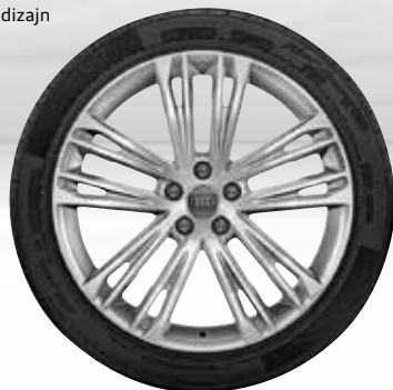
36 5-dvojitých lúčov-V-dizajn