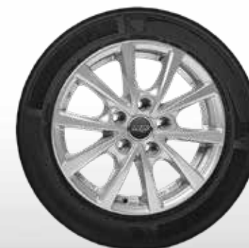
76 AZW Peak