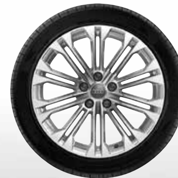
20 10-paraľelných lúčov