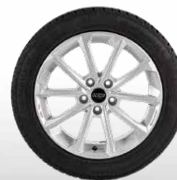
72 AZW Diamant