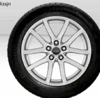
71 AZW Lumi