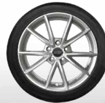
73 AZW Roma